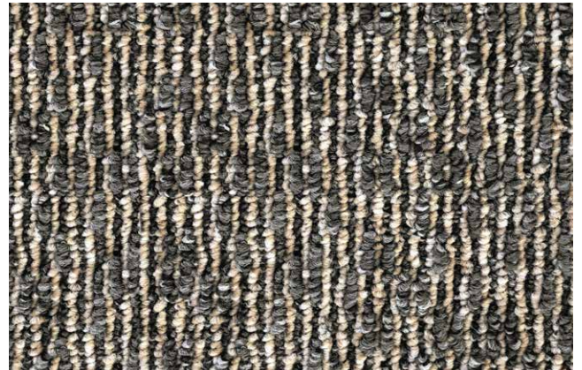
49 3m + 4m