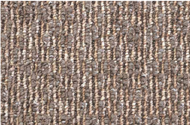
42 3m + 4m