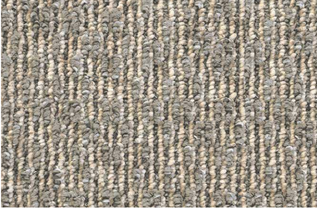
39 3m + 4m