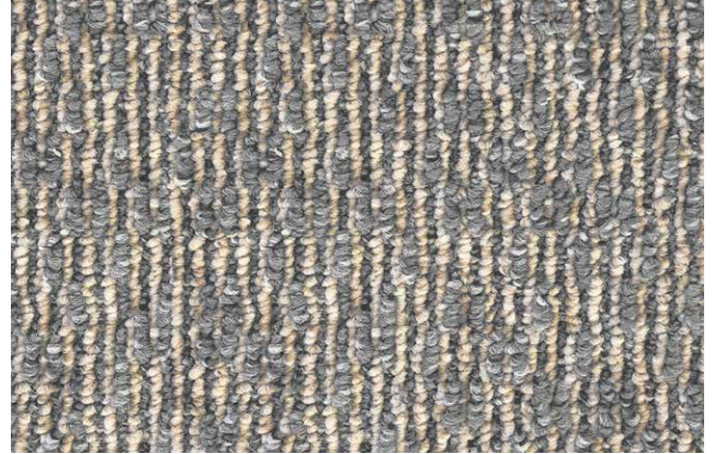
94 3m + 4m