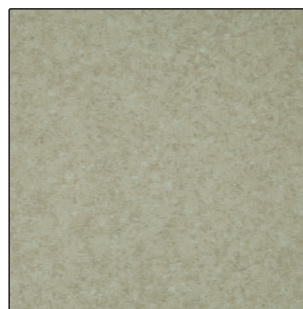
▲ MISTRAL 17